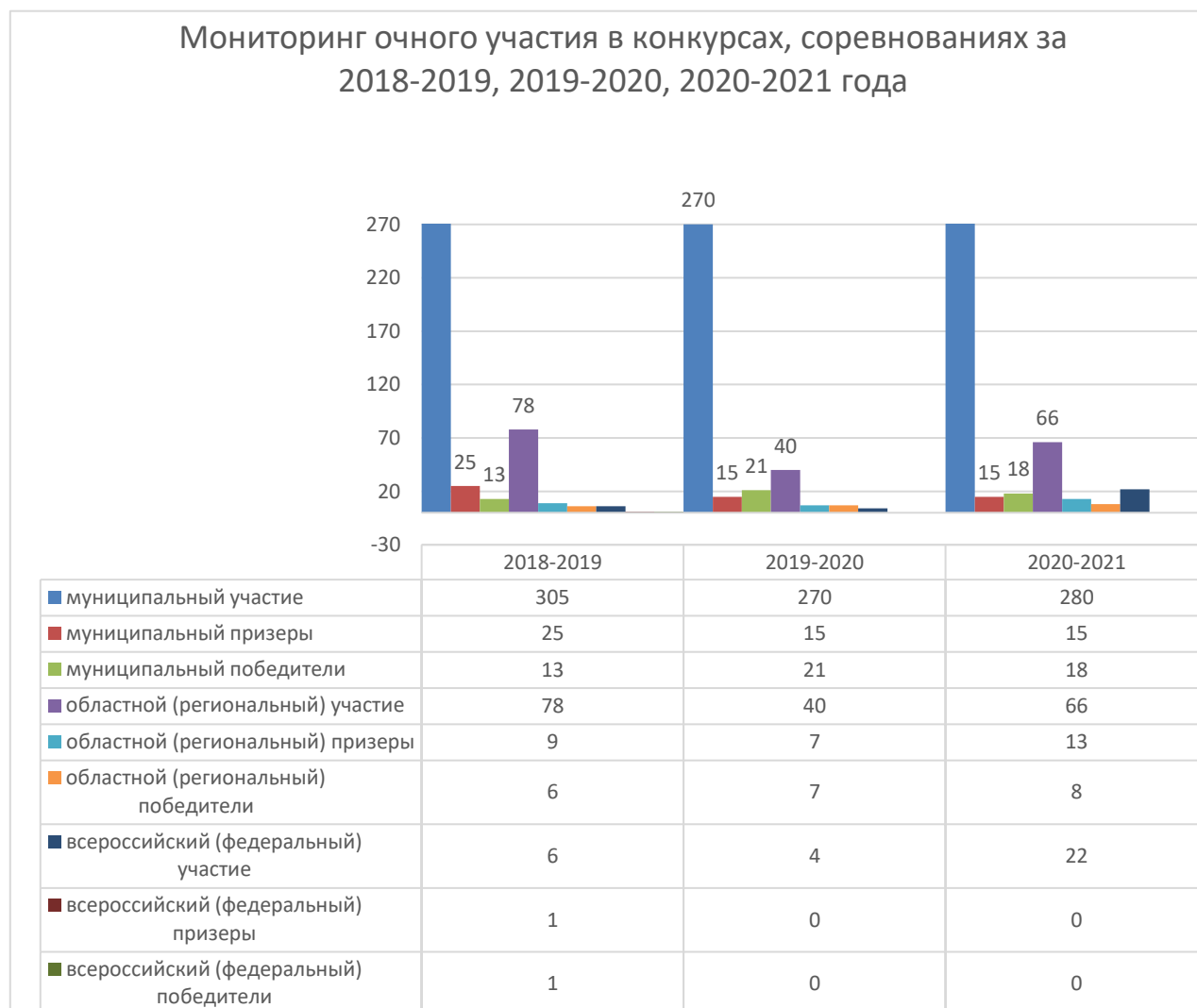
Мониторинг очного участия в конкурсах, соревнованиях за 2018-2019, 2019-2020, 2020-2021 года

Выводы: Увеличилось количество участников конкурсного движения на муниципальном, региональном, всероссийском уровне. Увеличилось количество призеров и победителей региональных конкурсов.